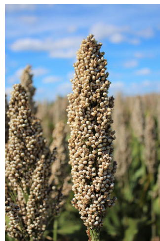
Panicule ES MOUSSON